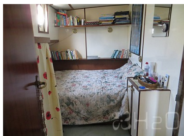
Cabine latérale double