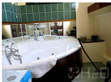
Salle de bain 1