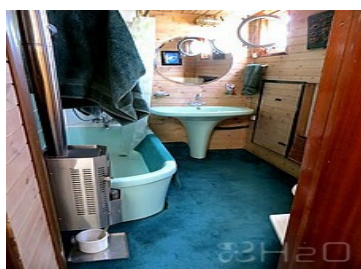
Salle de bain 2