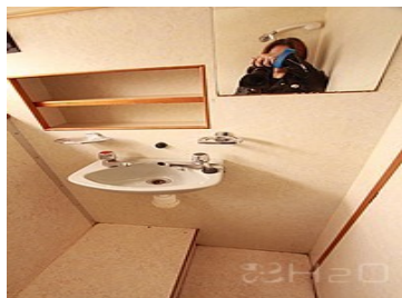
Salle de bain avant