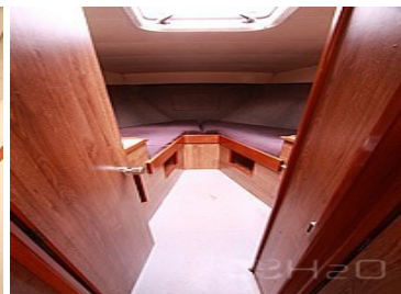
Cabine avant 2