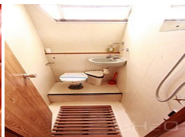
Salle de bain 2