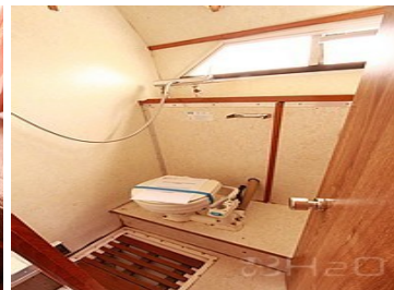
Salle de bain avant