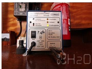
Chargeur de batteries