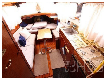
Cuisine et dinette