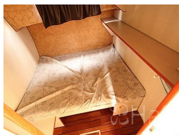
Cabine latérale 3