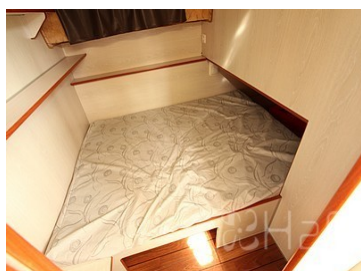
Cabine latérale 2