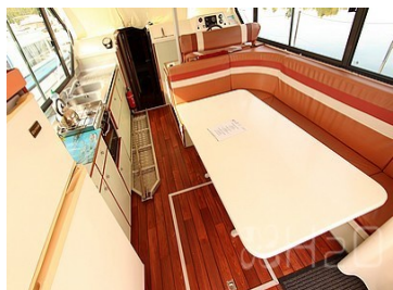
Dinette et cuisine