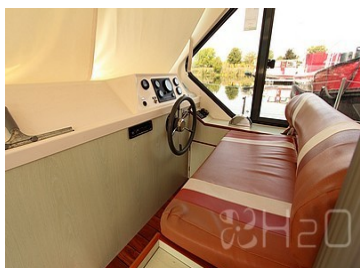
Poste de pilotage