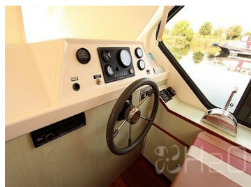
Poste de pilotage