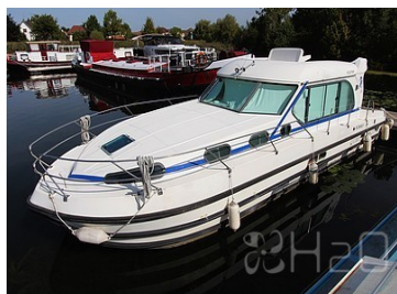
Nicols Sedan 1170