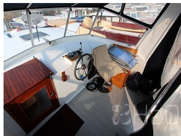
Poste de pilotage