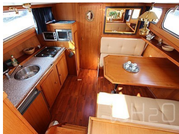
Cuisine et dinette