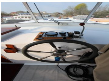
Poste de pilotage