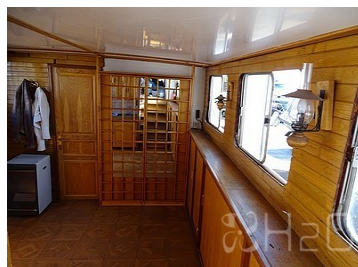
Espace de vie principale