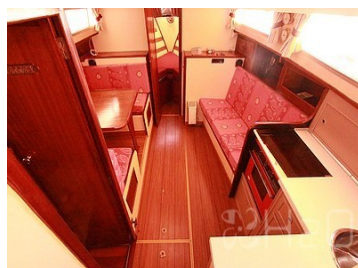
Cuisine et dinette