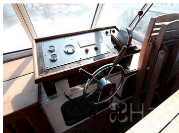
Poste de pilotage