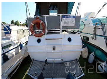
Plateforme de bain