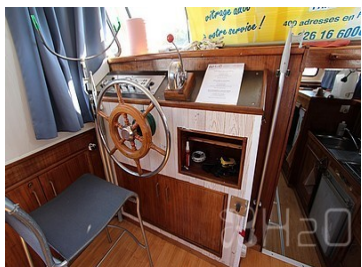
Poste de pilotage