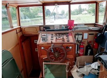
Poste de pilotage