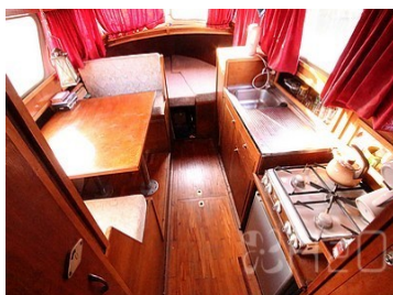
Cuisine et dinette