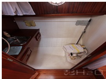
salle de bains