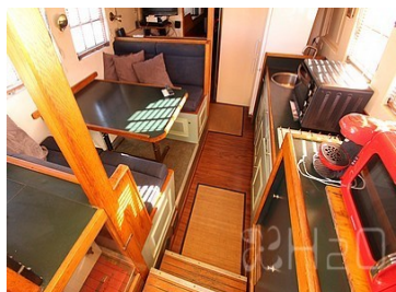
Dinette et cuisine