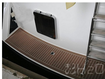
Plateforme de bain