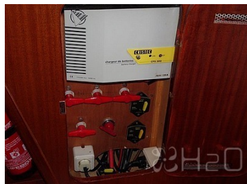
Chargeur de batteries