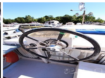
Poste de pilotage