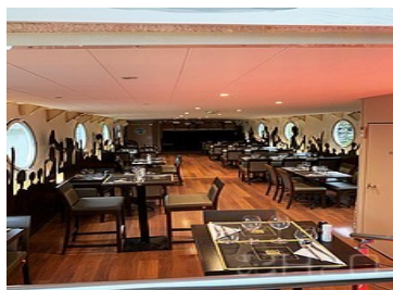
Salle de restauration