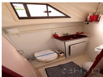
Salle de bain 2