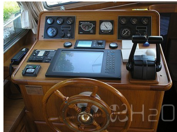
Poste de pilotage