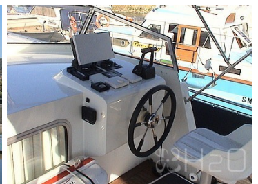
Poste de pilotage