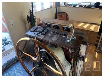
Poste de pilotage