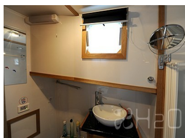
Salle de bain avant