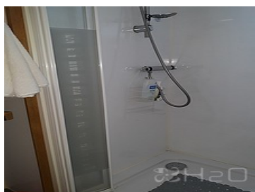
Salle de bain avant