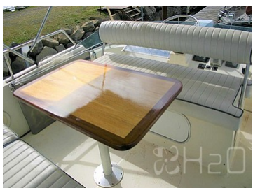
Terrasse sur flybridge