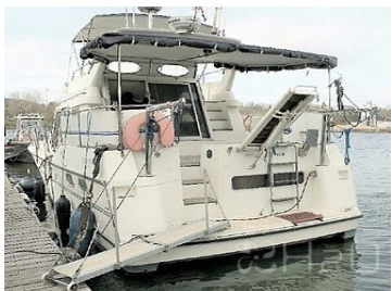
Plateforme de bain