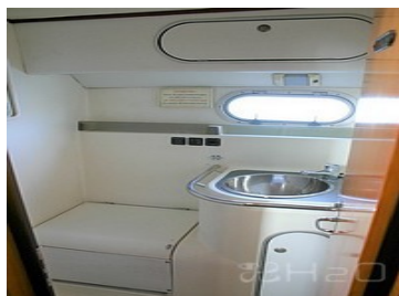
Salle de bain arrière