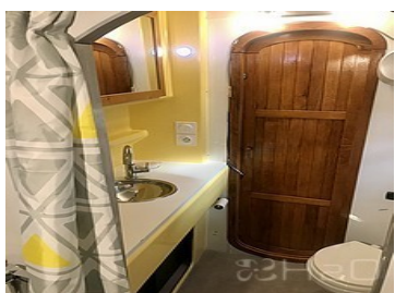
Salle de bain 1