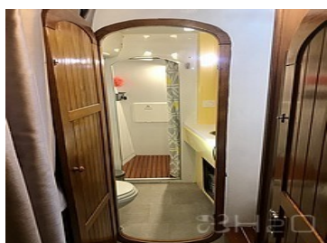
Salle de bain 1