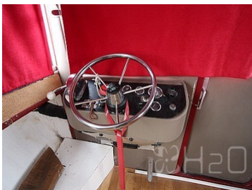
Poste de pilotage