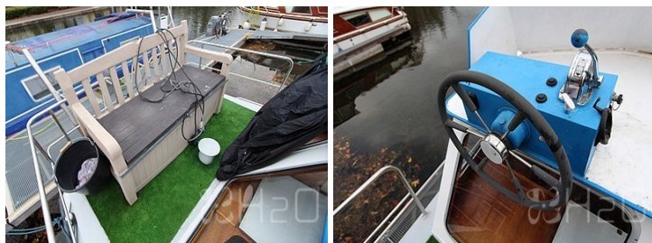
Poste de pilotage