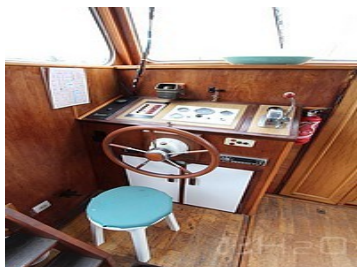
Poste de pilotage