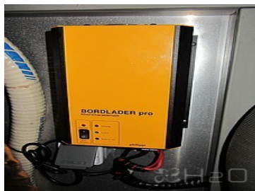
Chargeur de batteries