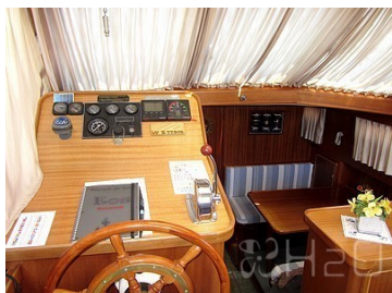
Poste de pilotage